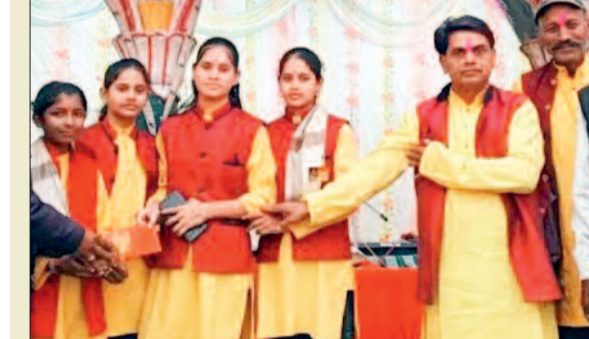
सम्मेलन का आयोजन मां महामाया बोलबम समिति द्वारा किया गया। आयोजन को सफल बनाने में युवा हिंदू दल समिति, बालरंग दल समिति, आशुतोष मानस मंडली समिति, आजाद एकता लक्ष्मी उत्सव समिति तथा समस्त गामवासियों का विशेष सहयोग रहा।